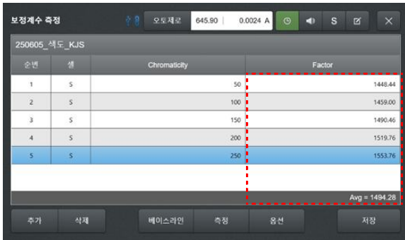
[그림 4]. 표준용액 측정 후 Factor 계산 결과 - 입력된 각 표준용액의 CU값과 자동 측정된 ΔE 값을 바탕으로 Factor(F)를 산출하며, 이들로부터 평균 F값인 1494.28이 자동으로 계산된다.

③ [보정계수 측정] 탭으로 자동으로 전환되며, 이 단계에서 표준용액 측정을 진행한다. 50 mm 롱패스셀에 표준용액을 담아 장비에 장착한 뒤, 각 표준용액의 CU 값을 입력하고 측정을 실행하면, 소프트웨어가 각 농도에서의 ΔE 값을 계산하고 이에 따른 Factor(F)를 자동 산출한다. 최종적으로 평균 F 값이 제시된다.