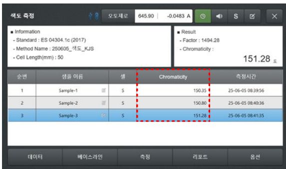
[그림 5]. 색도 기준 시료(150 CU) 측정 결과 화면 - 본 화면은 150 CU 기준 시료의 반복 측정 결과 예시이며, 동일한 방식으로 50 CU 및 250 CU 기준 시료도 각각 3회 측정하였다.