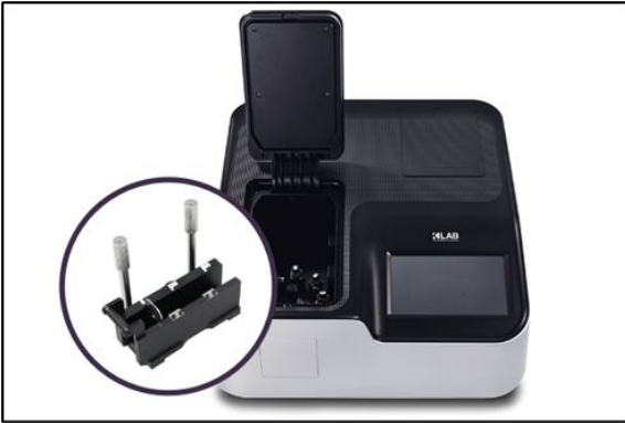
[그림 1]. Alpha UV-Vis 분광광도계 및 롱패스셀 전용 홀더 - K LAB의 Alpha는 더블 빔 방식의 UV-Vis 분광광도계로, 10 mm 셀 외에도 ADMI 분석에 필요한 50 mm 롱패스셀을 장착할 수 있도록 전용 셀 홀더를 교체 장착할 수 있다. 이로써 투과율이 낮은 폐수 시료도 정확하게 분석할 수 있으며, 수질오염공정시험기준의 권장 조건을 충족한다.