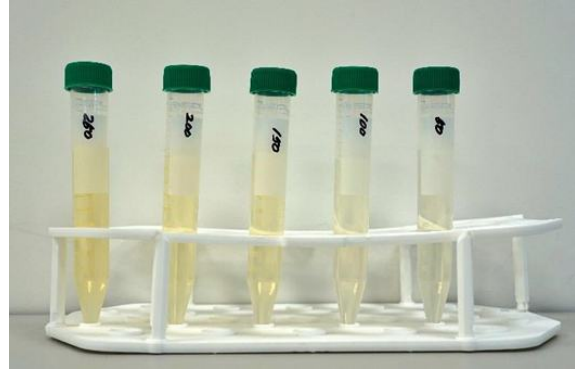
[그림 2]. 50 ~ 250 CU 색도 표준용액 시료